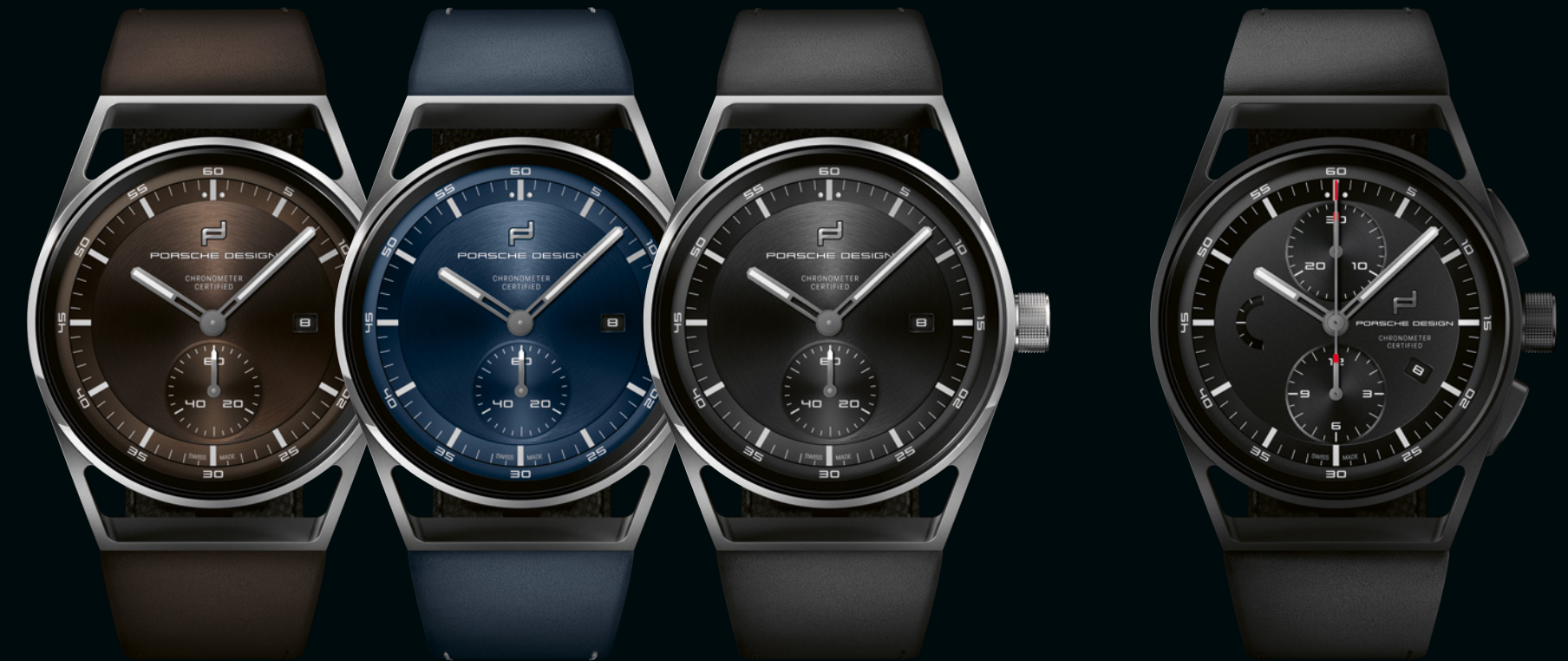
SPORT CHRONO SUBSECOND TITANIUM & BROWN

Erstmals in der Geschichte von Porsche Design erscheint dabei ein Timepiece mit der Subsecond-Uhr in zwei verschiedenen Größen: in der bekannten 42-mm-Variante und zusätzlich jetzt auch in 39 mm.