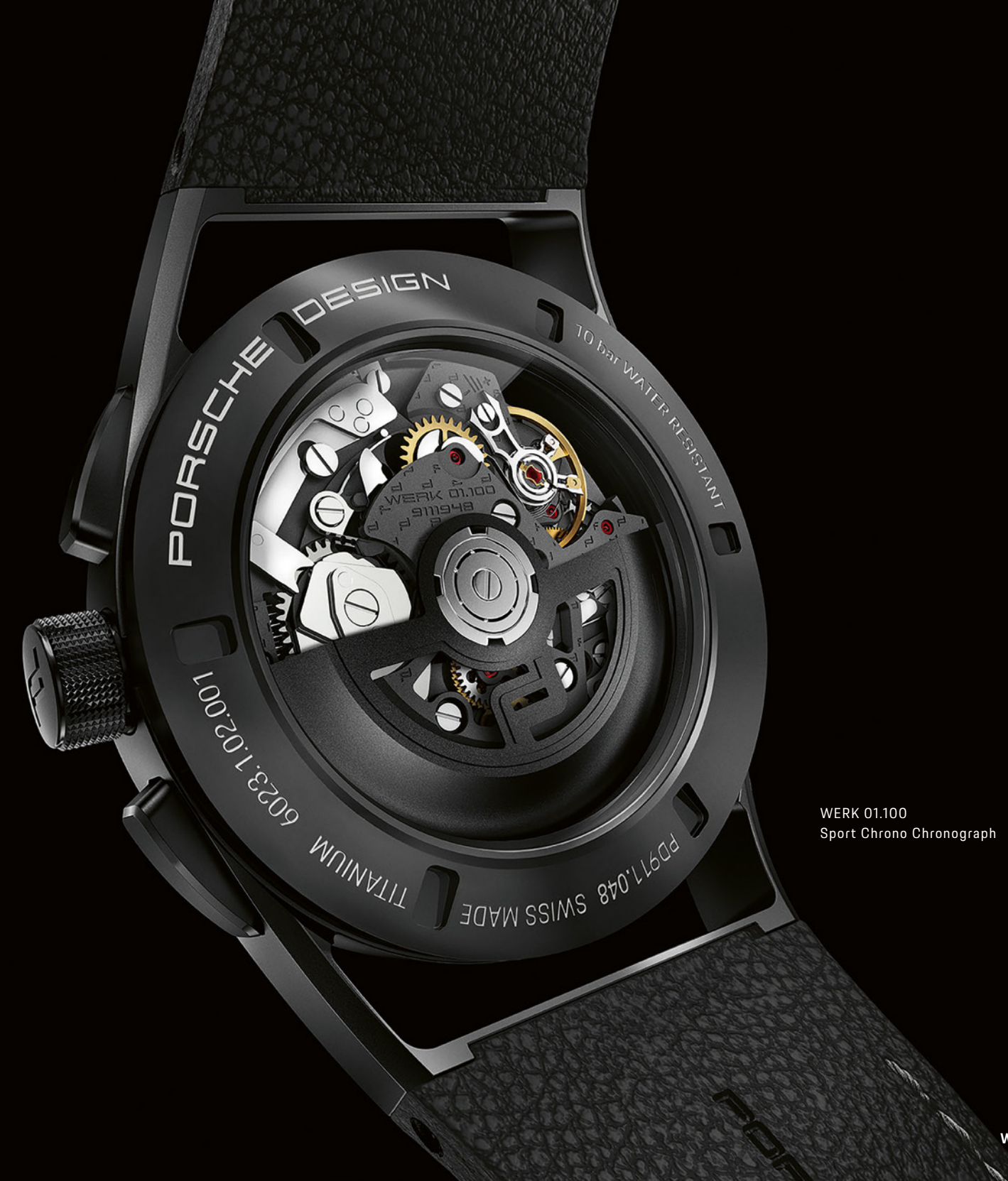
WERK 01.100 Sport Chrono Chronograph

Diese perfekte Symbiose wird seit 2014 in Solothurn in hochwertige Zeitmesser übersetzt – in der Porsche Design eigenen Uhrenmanufaktur, der Porsche Design Timepieces AG. Dort arbeiten Ingenieure und Uhrmacher Schulter an Schulter, um aus jedem Modell das Maximum an Performance herauszuholen. Um jedes Design noch etwas zeitloser zu machen. Und um die gewohnte Porsche Qualität nicht nur in Fahrzeuge zu bringen, sondern auch auf Armbanduhren zu übertragen. Und so jeder Sekunde einen ganz neuen Wert zu verleihen.