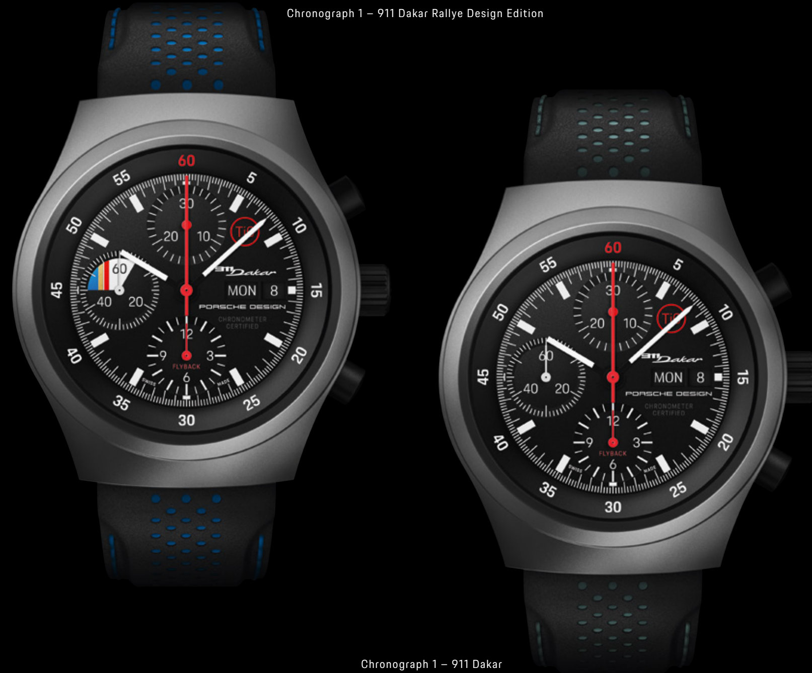
Chronograph 1 – 911 Dakar