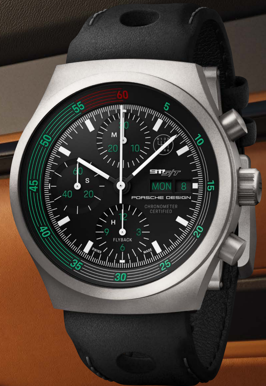
Chronograph 1 – 911 S/T