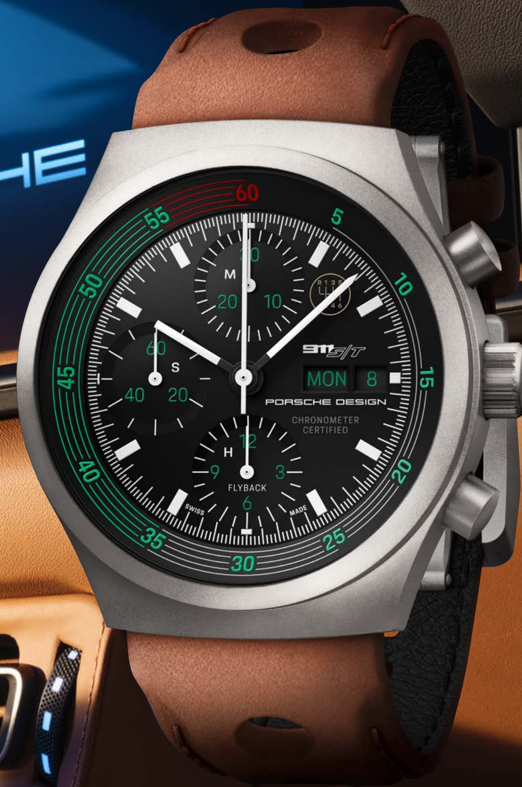
Chronograph 1 – 911 S/T Heritage

Quando si ragiona sulla funzione di qualcosa, a volte poi la forma viene naturale. Di conseguenza, tutto sembra essere creato in un unico pezzo, anche se è realizzato in pelle. I cinturini in pelle interpretano il concetto di struttura leggera della 911 S/T con un motivo a fori simmetrici che elimina ogni milligrammo superfluo. Ed è così che l'artigianato tradizionale si combina con la moderna tecnologia del motorsport. La pelle della vettura e il filato interno utilizzati a questo scopo formano un'unione ancora più stretta tra auto sportiva e cronografo. Anche il cinturino in titanio, inclusa la chiusura deployante con il logo Porsche Design inciso al laser, prosegue il concetto di struttura leggera e riduce al minimo il rapporto peso/potenza nel prossimo giro veloce. La scelta è quindi tutt'altro che facile. Ma qualunque versione tu scelga, avrai sempre al polso i 60 anni di storia della 911.