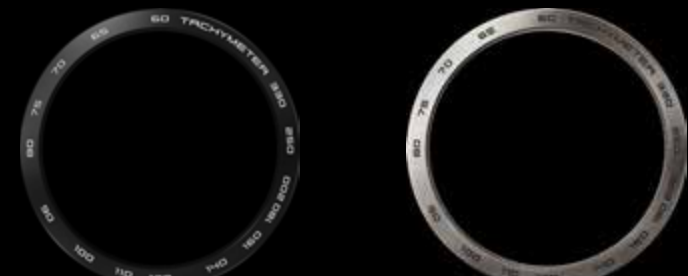
Titanio nero, tachimetro