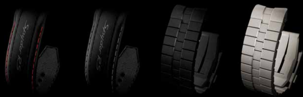
Pelle nera, cuciture decorative rosso carminio