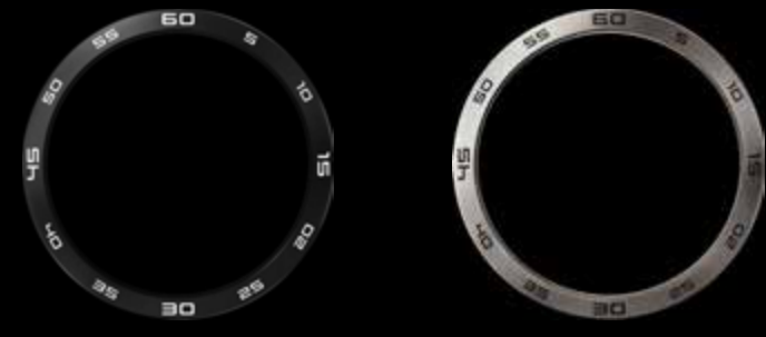
Titanio nero, scala dei minuti